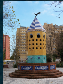
Fotos / 1- Fuente-Torre de los Vientos, La Línea de la Concepción 2- Rejas de la casa del artista, Tarifa 3- Virgen del Perpetuo Socorro, Tarifa

En Tarifa, su ciudad natal, podemos ver "la casa del artista", en la que pretende que la puerta sea como el ojo