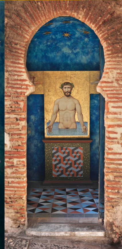
Foto / El Cristo de los Vientos, Tarifa

En la Línea de la Concepción, nos encontramos con la "Fuente-Torre de los Vientos", en la que sus ocho caras representan todos los puntos cardinales.